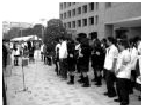
自転車盗難ゼロ計画開会式の様子

自 転 車 盗 難 ゼ ロ 計 画 進 行 中 ！ in 明 海 祭 浦安市学生防犯委員会 5の主催事業である『 自転車盗難ゼロ計画』が 十一月五日に開催されま した。今年も明海大学の 協力を得て、文化祭の中 で啓発を行うという初め での試みです。啓発の内 容は、5ブーアの周辺で の物資の配布・明海大学 内の駐輪場でのワイヤー錠装着調査に加え、イベント ステージにて東京学館浦安高校の吹奏楽部の演奏と、 浦安高校のよさこいソーランを披露しました。